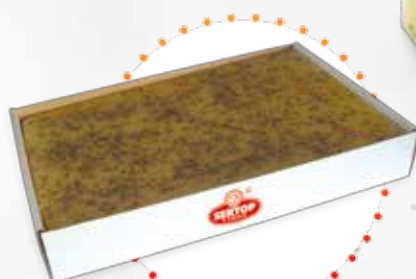
Domowy z kminkiem Home-made with caraway