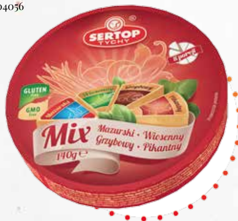
Mix: Mazurski, Wiosenny, Grzybowy, Pikantny Mix: Mazurski, Spring, Mushroom, Spicy