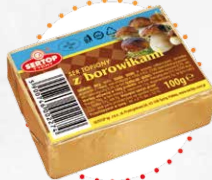
Z borowikami With boletus