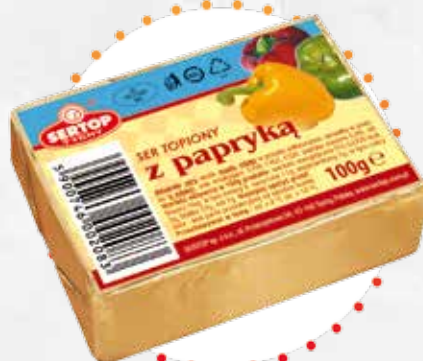
Z papryką | With paprika