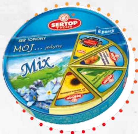
Mix: Mój jedyny Mix: My delicious EAN 590074601108