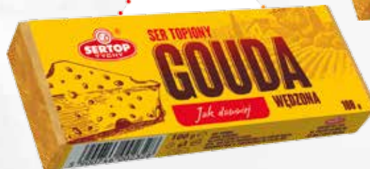
Gouda wędzona | Smoked gouda