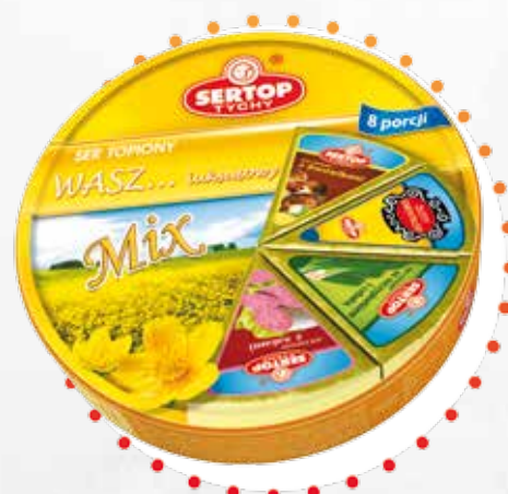
Mix: Wasz luksusowy Mix: Your superb EAN 590074601139