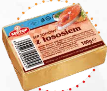
Z łososiem | With salmon