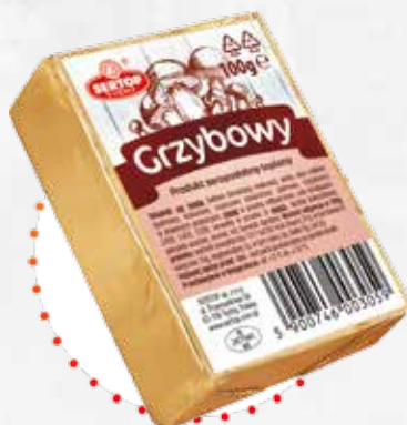
Grzybowy | Mushroom