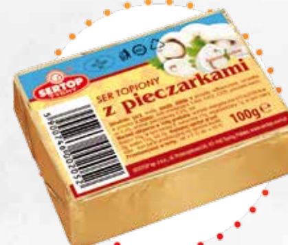
Z pieczarkami With champignons