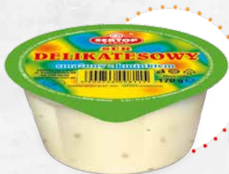
Delikatesowy z kminkiem Delicacy with caraway