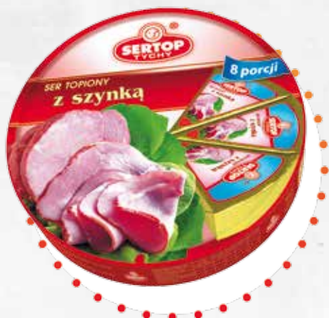
Z szynką | With ham