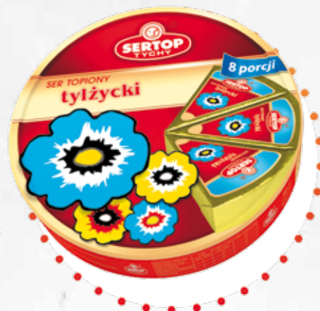
Tylżycki | Tilsiter