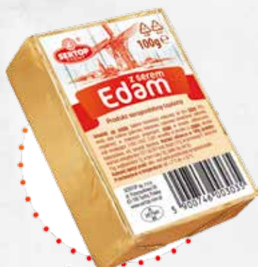
Z serem Edam With Edam cheese