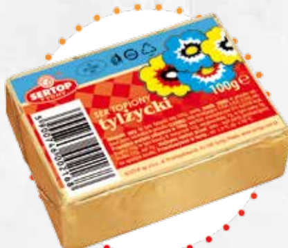
Tylżycki | Tilsiter