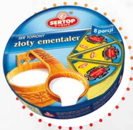
Złoty Ementaler Golden Ementaler EAN 5900746011016