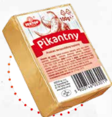
Pikantny | Spicy