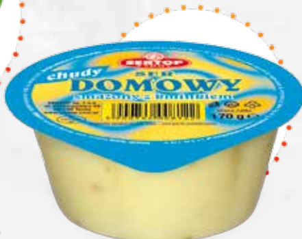
Domowy z kminkiem Home-made with caraway