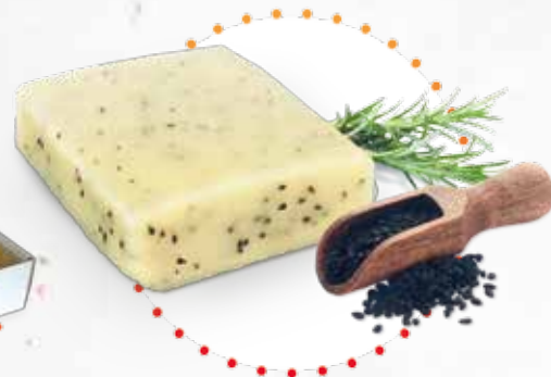
Smażony z czarnuszką Fried cheese with black cumin