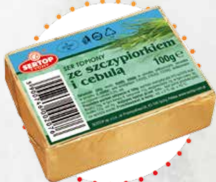
Ze szczypiorkiem i cebulą With spring onion and onion