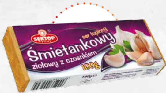
Śmietankowy ziołowy z czosnkiem Creamy with herbs and garlic