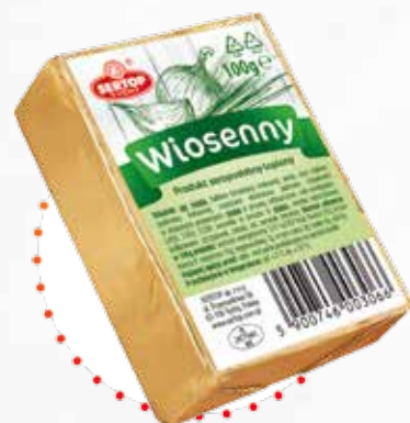
Wiosenny | Spring