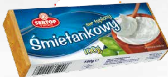
Śmietankowy | Creamy