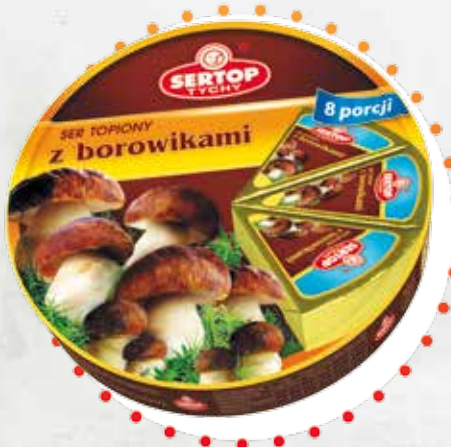
Z borowikami | With boletus EAN 590074601153