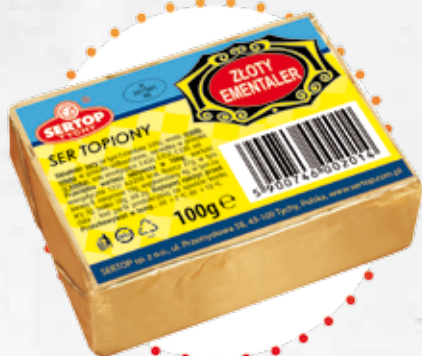
Złoty Ementaler | Golden Ementaler