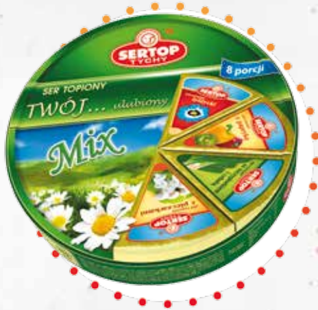
Mix: Twój ulubiony Mix: Your favourite EAN 590074601115