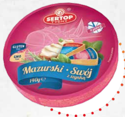
Mazurski | Swój z szynką Mazurski | With ham