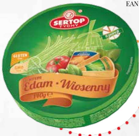
Z serem Edam / Wiosenny With Edam cheese / Spring