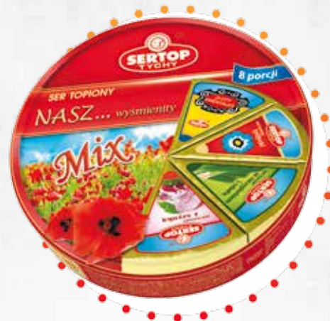
Mix: Nasz wysmienity Mix: Our delectable EAN 590074601122