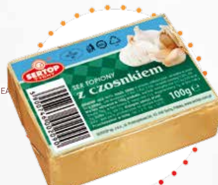
Z czosnkiem | With garlic