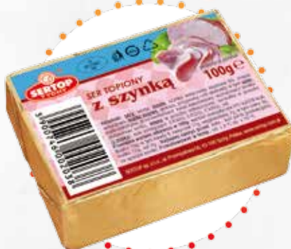
Z szynką | With ham