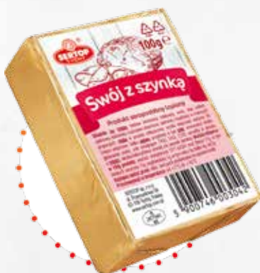
Swój z szynką | With ham