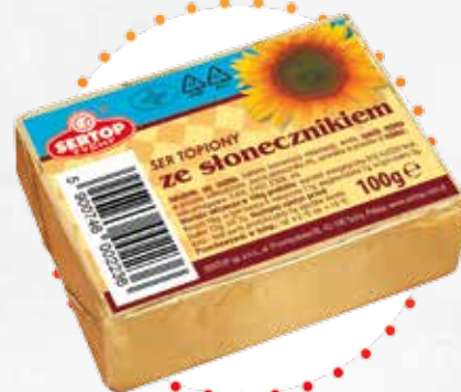
Ze słonecznikiem With sunflower