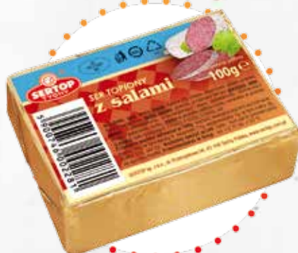
Z salami | With salami