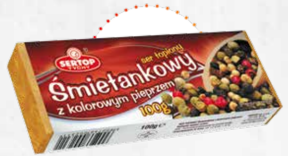
Śmietankowy z kolorowym pieprzem Creamy with colourful pepper