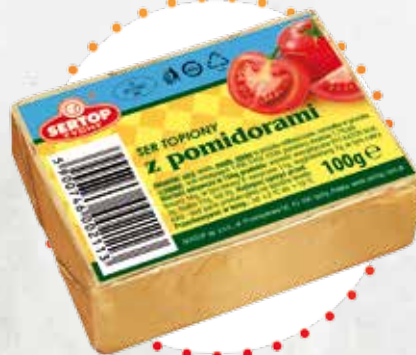
Z pomidorami With tomatoes