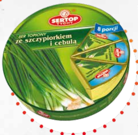
Ze szczypiorkiem i cebulą With spring onion and onion