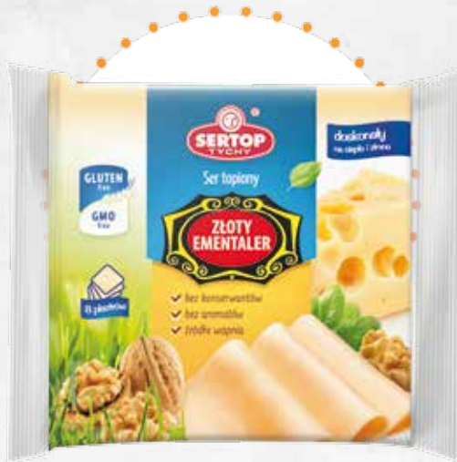
Złoty Ementaler Golden Ementaler