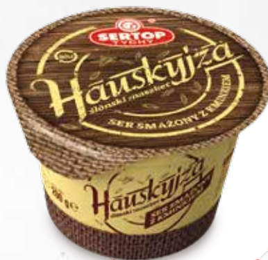
Hauskyjza Fried Hauskyjza cheese