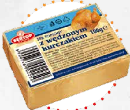
Z wędzonym kurczakiem With smoked chicken