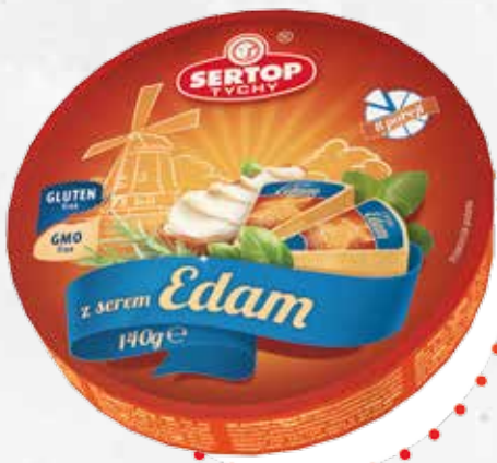
Z serem Edam | With Edam cheese